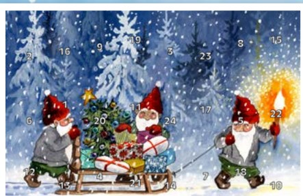
FORENINGENS NAVN Julekalender 2020