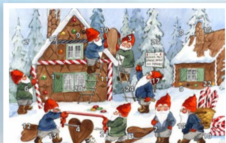
FORENINGENS NAVN Julekalender 2020