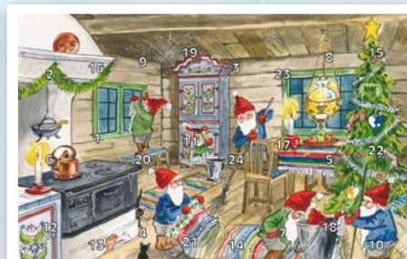
FORENINGENS NAVN Julekalender 2020