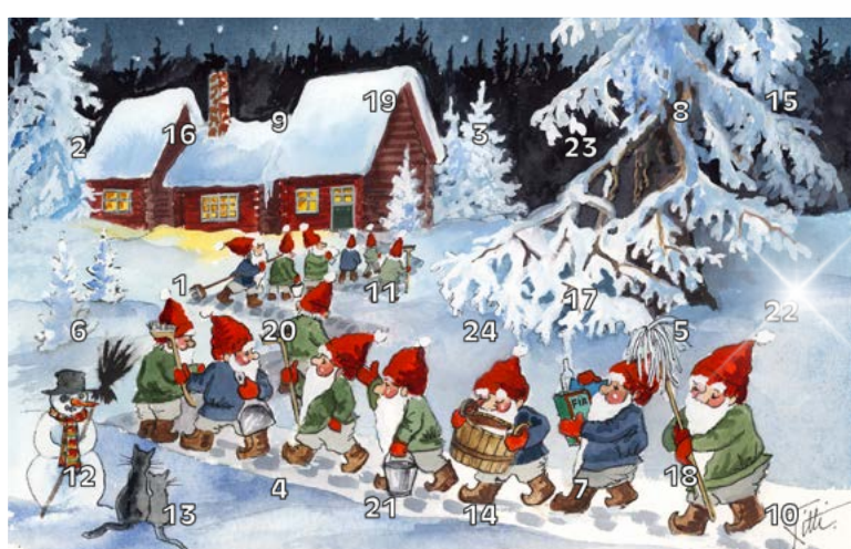
FORENINGENS NAVN Julekalender 2020

Siste frist for innsending av materiell er 20. oktober 2020