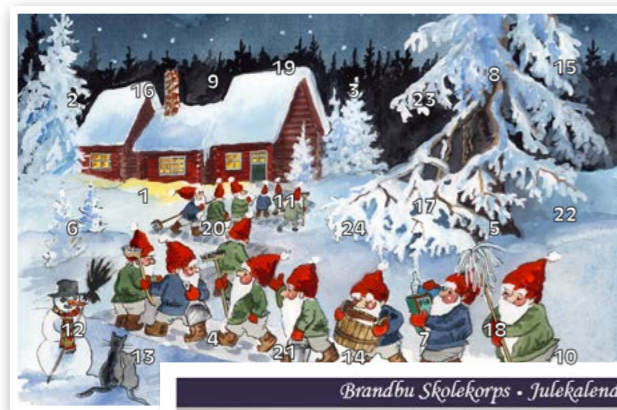
Forside motiv nr. 1

Vi har et bredt utvalg av gevinster til en hyggelig pris.