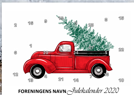
FORENINGENS NAVN Julekalender 2020