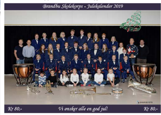
Eget motiv Tillegg i pris på kr 3 000,-